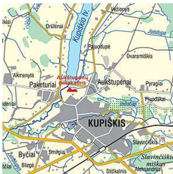
1.1 pav. Situacijos schema

Piliakalnis pasiekiamas nuo Kupiškio bažnyčios važiuojant 250 m į šiaurės vakarus Muziejaus gatve, pavažiavus į dešinę Piliakalnio gatve 500 m. Prie piliakalnio šiaurės rytų papėdės galima privažiuoti Pergalės ir Vėžionių gatvėmis, iš jos pasukus į kairę link užtvankos (čia įrengta mašinų stovėjimo aikštelė).